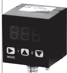
Vacuostato/Pressostato Serie SWC